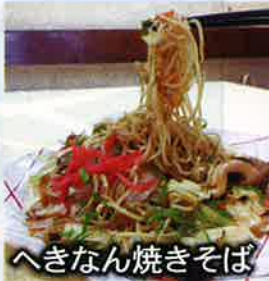
へきなん焼きそば