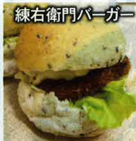
練右衛門バーガー