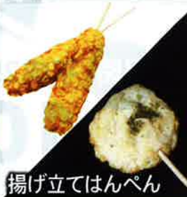
揚げ立てはんぺん