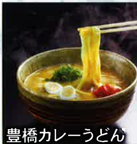
豊橋カレーうどん