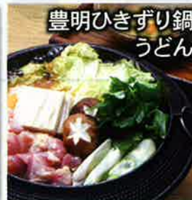
豊明ひきずり鍋 うどん