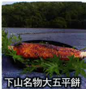
下山名物大五平餅