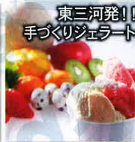
東三河発!! 手づくりジェラート