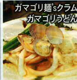
ガマゴリ麵sくらム ガマゴリうどん