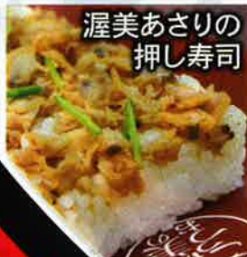
渥美あさりの 押し寿司