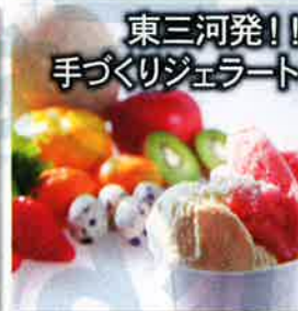
東三河発!! 手づくりジェラート