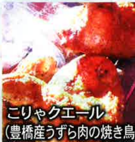
こりゃクエール (豊橋産うずら肉の焼き鳥)