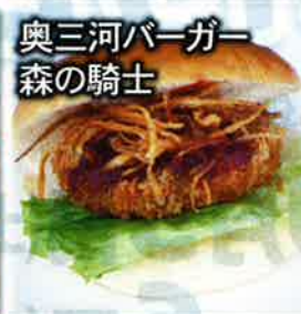
奥三河バーガー 森の騎士